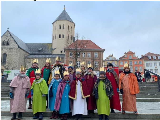
Die Altenbekener Sternsingergruppe auf der Treppe vor dem Paderborner Dom.

Am vergangenen Samstag, 21. Januar, hat sich ein Teil der Altenbekener Sternsinger noch einmal auf den Weg gemacht. Gemeinsam mit etwa 700 weiteren Sternsängern aus dem gesamten Erzbistum Paderborn waren sie der Einladung des BDKJ (Bund der Deutschen Katholischen Jugend) zur Diözesanen Dankesfeier der Sternsingeraktion gefolgt. Nach einer heiligen Messe mit Weihbischof Matthias König im Hohen Dom zu Paderborn ging es in einem Umzug durch die Innenstadt zum Kino Pollux, wo abschließend noch gemeinsam ein Film geschaut wurde. Wir danken dem BDKJ für diese tolle Aktion, aber auch unseren Sternsängern für Ihren Einsatz zur Unterstützung hilfsbedürftiger Kinder.