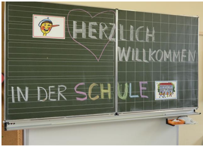
Grafik Christian Schmitt, pfarrbriefservice