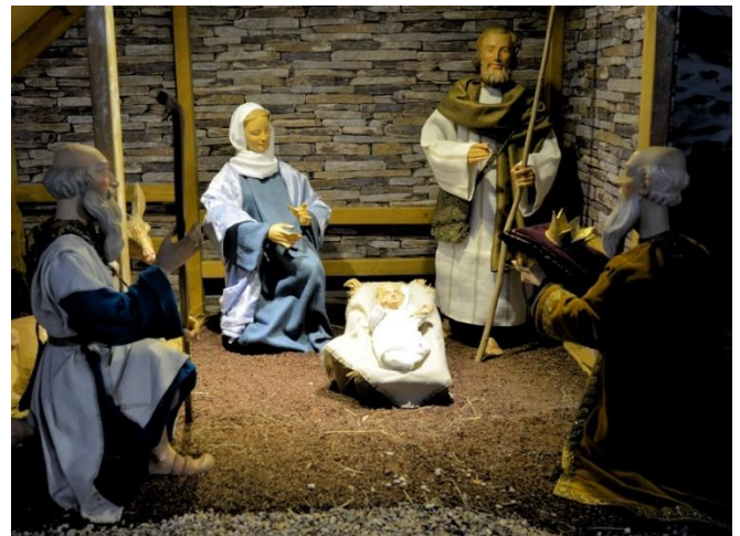
Krippe Heilig Kreuz Altenbeken

WIR WÜNSCHEN ALLEN GEMEINDEMITGLIEDERN UND GÄSTEN EIN GESEGNETES WEIHNACHTSFEST UND EIN FROHES NEUES JAHR 2024