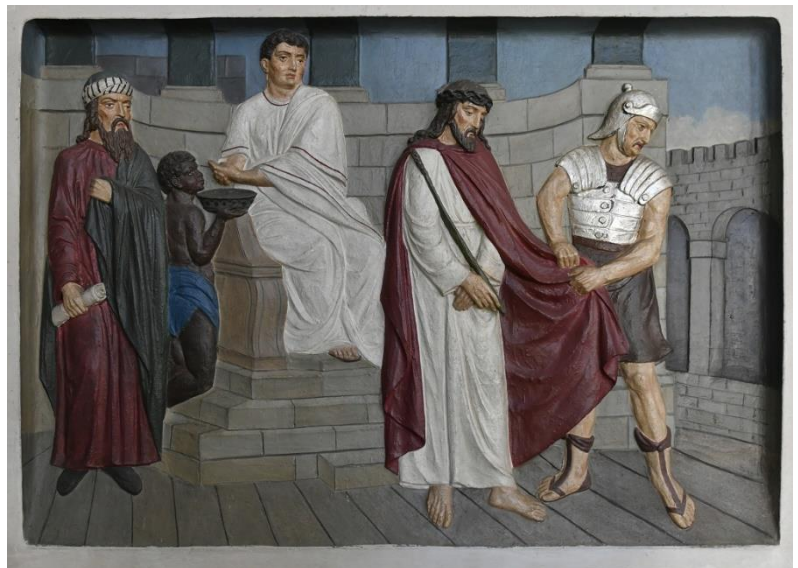
Kreuzweg St. Dionysius Buke

„Während er betete, veränderte sich das Aussehen seines Gesichts.“