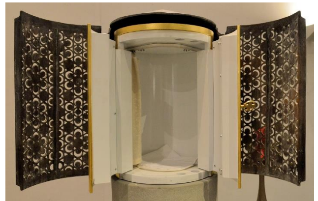
Tabernakel in der Filialkirche St. Maximilian nach dem letzten kath. Gottesdienst

im Februar 2018 mussten Sie von der St. Maximilian – Kirche in Bad Lippspringe Abschied nehmen. Auch wenn die Kirche nun einer anderen Konfession dient, wanderten die wichtigsten Ausstattungsstücke Altar, Ambo und Tabernakel ins Archiv. Im Februar 2024 nun werden sie wieder in Dienst genommen – in Ihrer direkten Nachbarschaft in Bad Meinberg. Durch die Neugestaltung der dortigen Christkönigskirche an der Parkstraße, haben wir aus ihren Formen heraus die neue Altarinsel gestaltet.