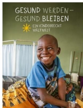
AKTION DREIKÖNIGSSINGEN 2024 - C4M4-S+22

Wir freuen uns, wenn die Aktion Dreikönigssingen gerade in der Corona-Pandemie als Zeichen der Solidarität und der gelebten Nächstenliebe heller denn je strahlt und bedanken uns bei allen, die sich unter den erschwerten Bedingungen für die Durchführung des Sternsingens engagieren und diese unterstützen.