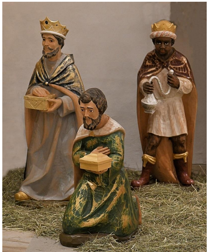
St. Johannes Baptist Herford

„Jesus ließ sich taufen; und während er betete, öffnete sich der Himmel.“