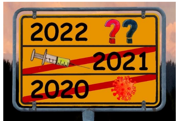
Illustrationen: Sara Weber in Pfarrbriefservice.de

Gisela Baltés, www.impulstexte.de , In: Pfarrbriefservice.de