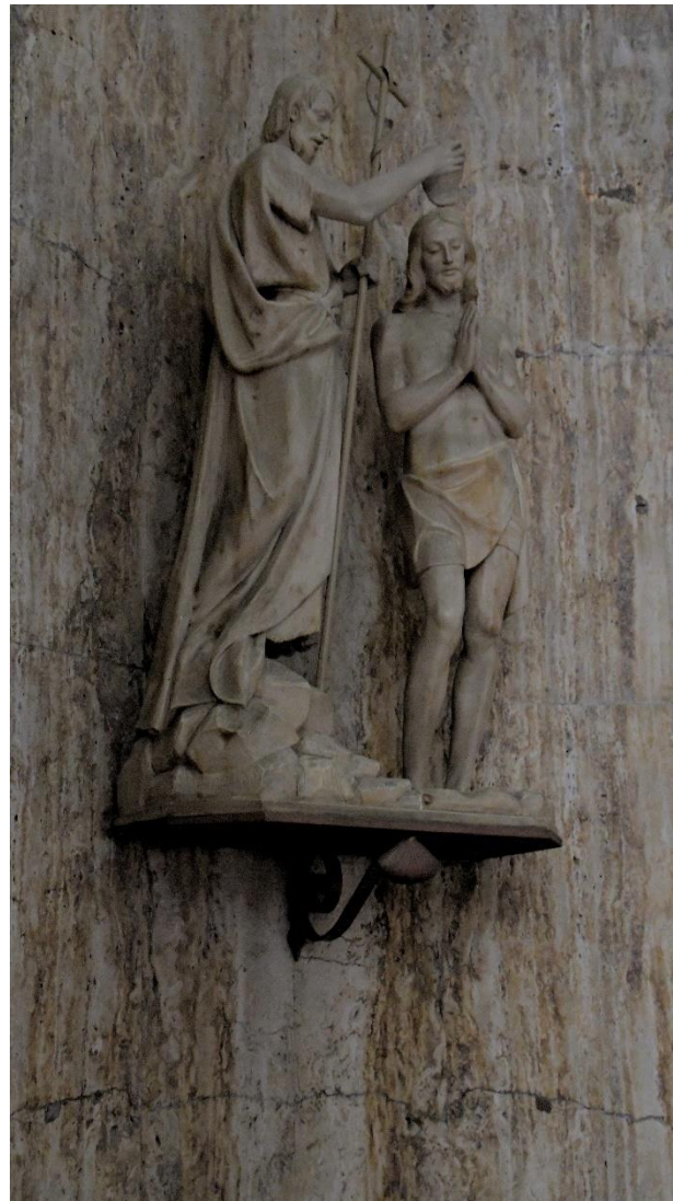
Chiesa Madre Basilica Santa Maria Assunta in Alcamo/Sizilien

„Als Jesus getauft war, sah er den Geist Gottes wie eine Taube auf sich herabkommen“