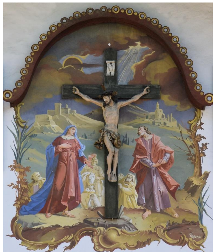
Oberammergau, Hotel Post

Dorothee Sandherr-Klemp (zu 1 Kor 1,22-25) aus: Magnificat. Das Stundenbuch 03/2021 , Verlag Butzon & Bercker, Kevelaer; www.magnificat.de ; Pfarrbriefservice.de