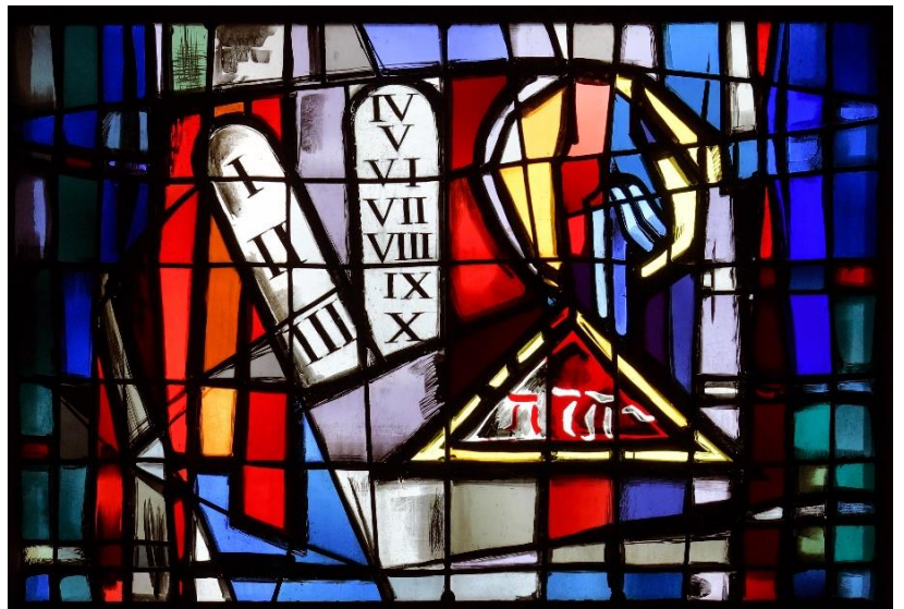
St. Michael Luxemburg